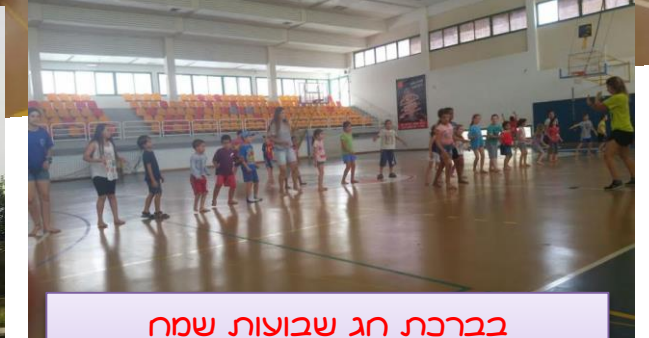
בברכת חג שבועות שמח קרני טטיאנה וענבל.