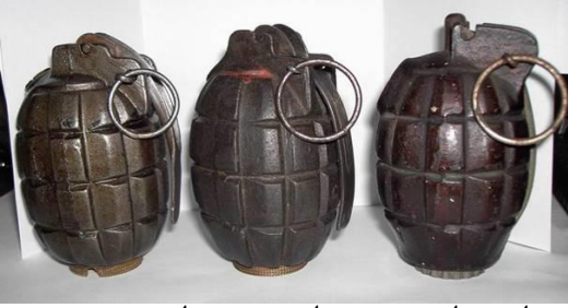
צילום של רימוני מיילס אורגינאליים