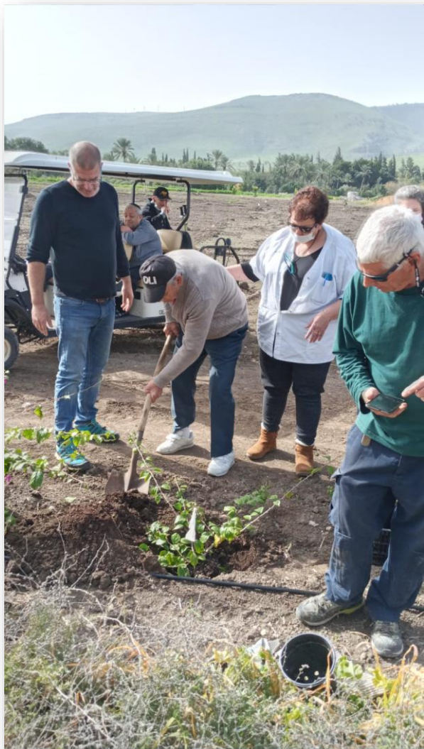
שותלים בוגונביליות בבוסתן החדש