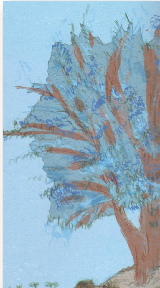
ציור: נעמה בניזמן