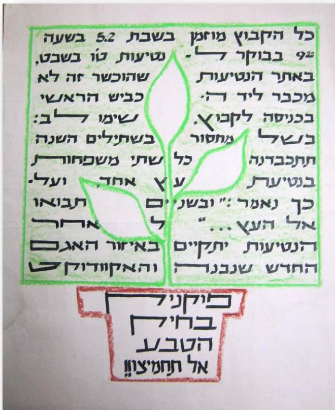
מלוח המודעות

סביב בית הילדים הקרוב ביותר לנחל, ליד מעברת הצינור השחור (בית 'אלומה' זה היה לפני 60+ שנה, היום מועדון הילדים 'שקדיה') שתלו בט"ו בשבט אחד שיחי נוי שונים כנהוג באותם הימים. שתלתי אני הילדה פוטוספרום מול קיר הכיתה מצפון, אמצעי בין שלושה. כשאני לפעמים עוברת במקום, אני מחייכת לו לשלום.