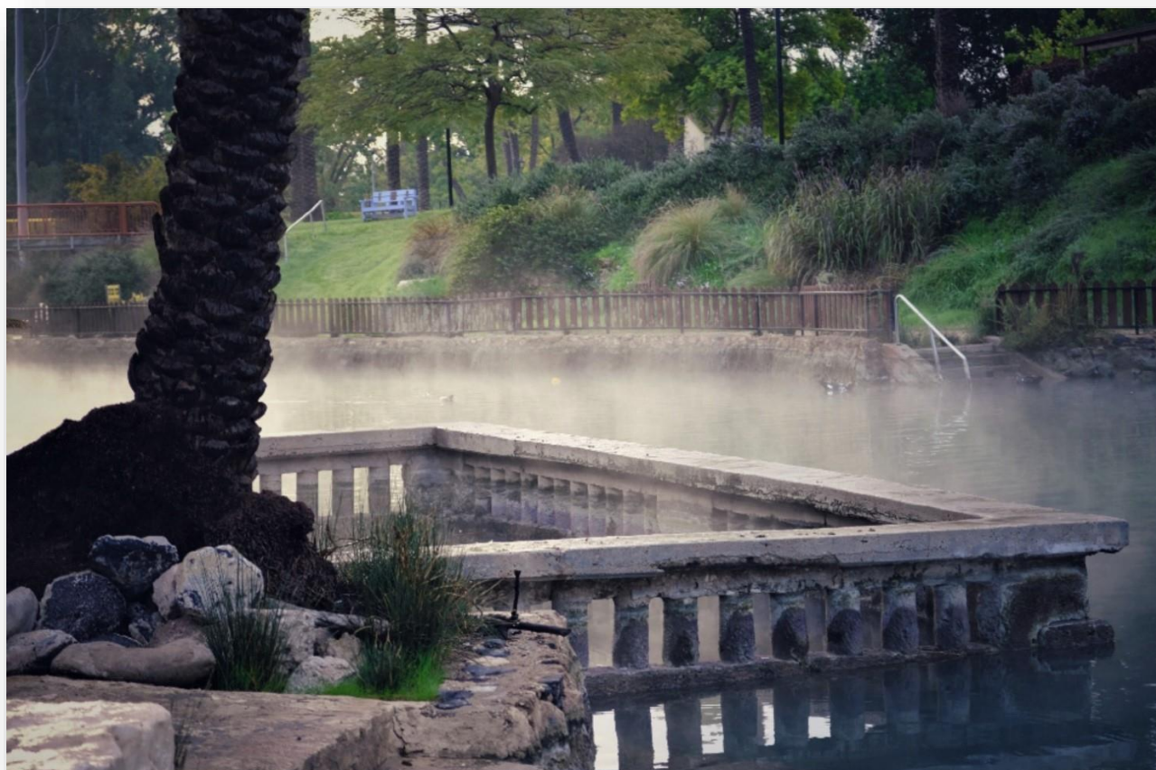
[התמונה הזוכה בתחרות צילומי נוף]