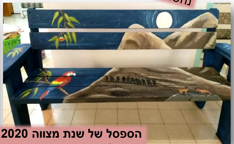
הספסל של שנת מצווה 2020 גלו איפה הוא ממוקם