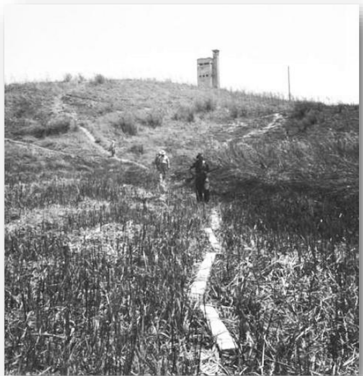
ירידה בשביל מאולתר, ראשון הולך אדם חמוש