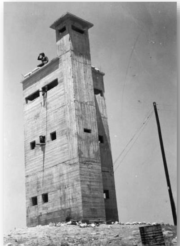
המגדל כעמדת שמירה

גם במלחמת העצמאות שימש המגדל על התל לצרכי תצפיות ושמירה. עם זאת ובדומה למקרים רבים אחרים: נוצר הצורך, מצאו את הפתרון, אך מהר מאוד לאחר הקמתו, פרצה מלחמת העולם השנייה, המרד הערבי הסתיים והצורך במגדל התצפית פחת מאוד ולבסוף הסתיים. המבנה ניצב כיום בגאון, כעדות אילמת אך מרשימה לאותם זמנים ומאורעות וכסמל לנחישות ולדבקות אותם חלוצים במשימת ההתיישבות וגאולת הקרקע בעמק בית שאן. על קיר המגדל נקבע שלט עם שמות הנופלים במארב.