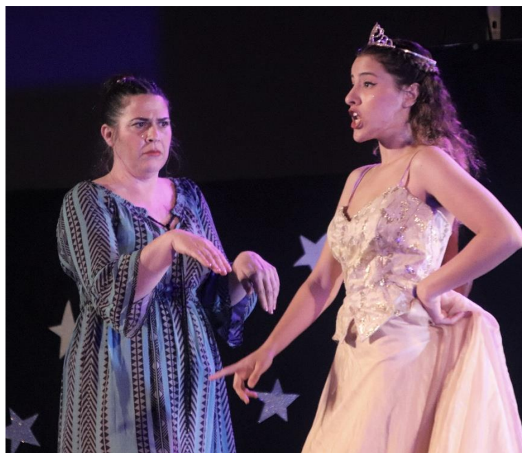
"ספחת מי" – שיר המריבה בין ושתי ואסתר