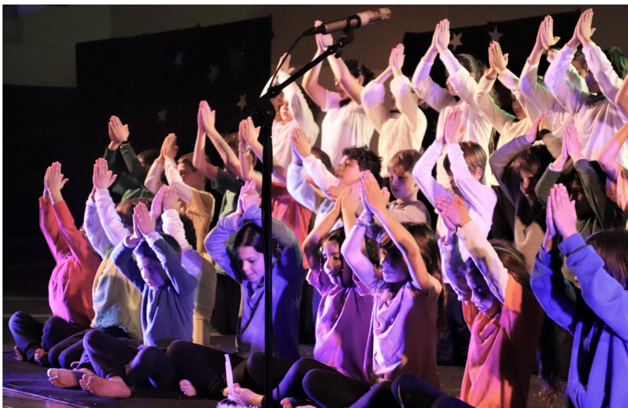
זרש – "אישתתו" של המן ועוזר האחשוורוש – "הלחשן"