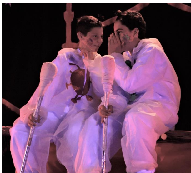
בגתן וְתִרְשׁ – הזוממים