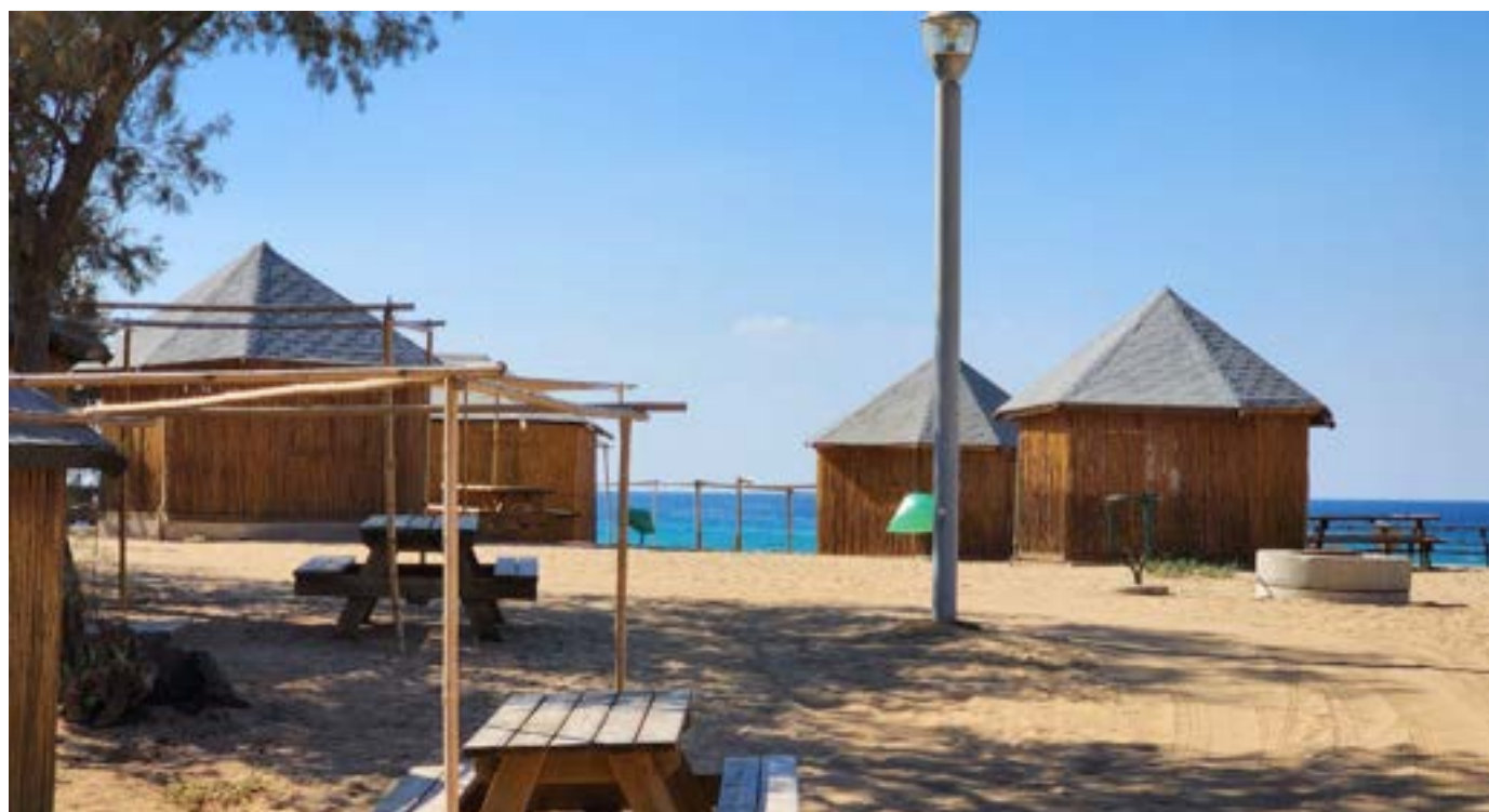
לינה בחניון של חוף אכזיב: מי בחושה ומי באוהל