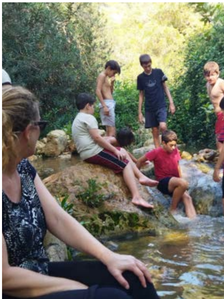
סיום המסלול הארוך בנחל בצת