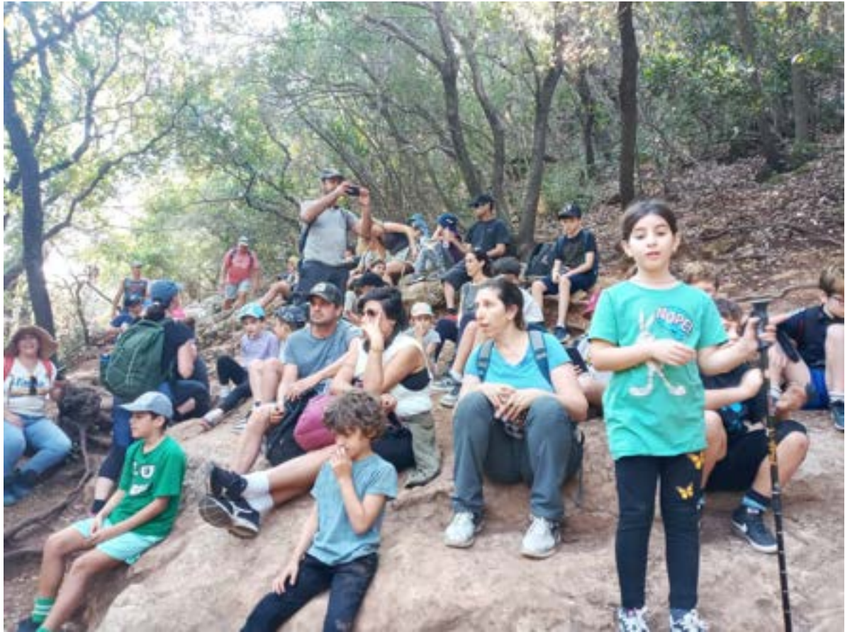
בדרך לנחל בצת