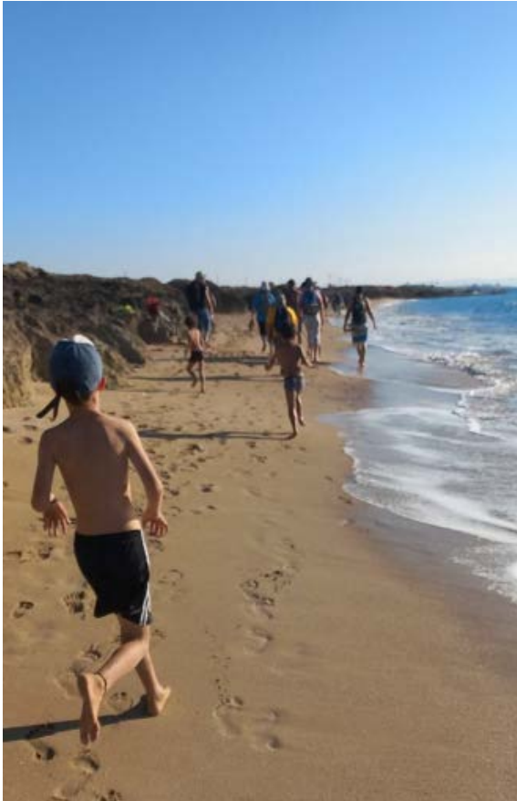
רחצה + הליכה מחוף בצת דרומה