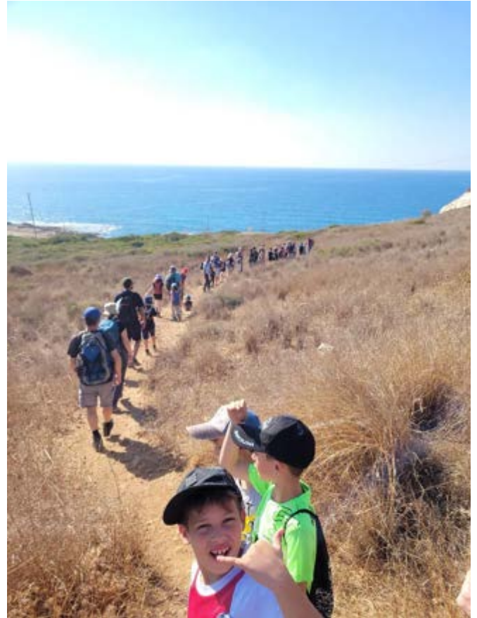
ירידה ממצפה ראש הנקרה לנקרות