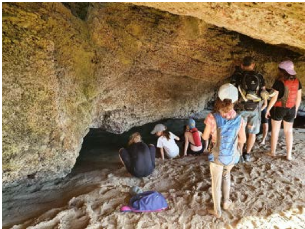
מערת מים בחוף בצת שנחשפת רק בזמן שפל