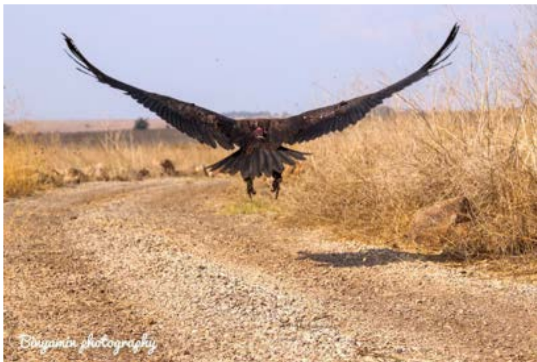
שחרור העזנייה עם המשדר על גבה.