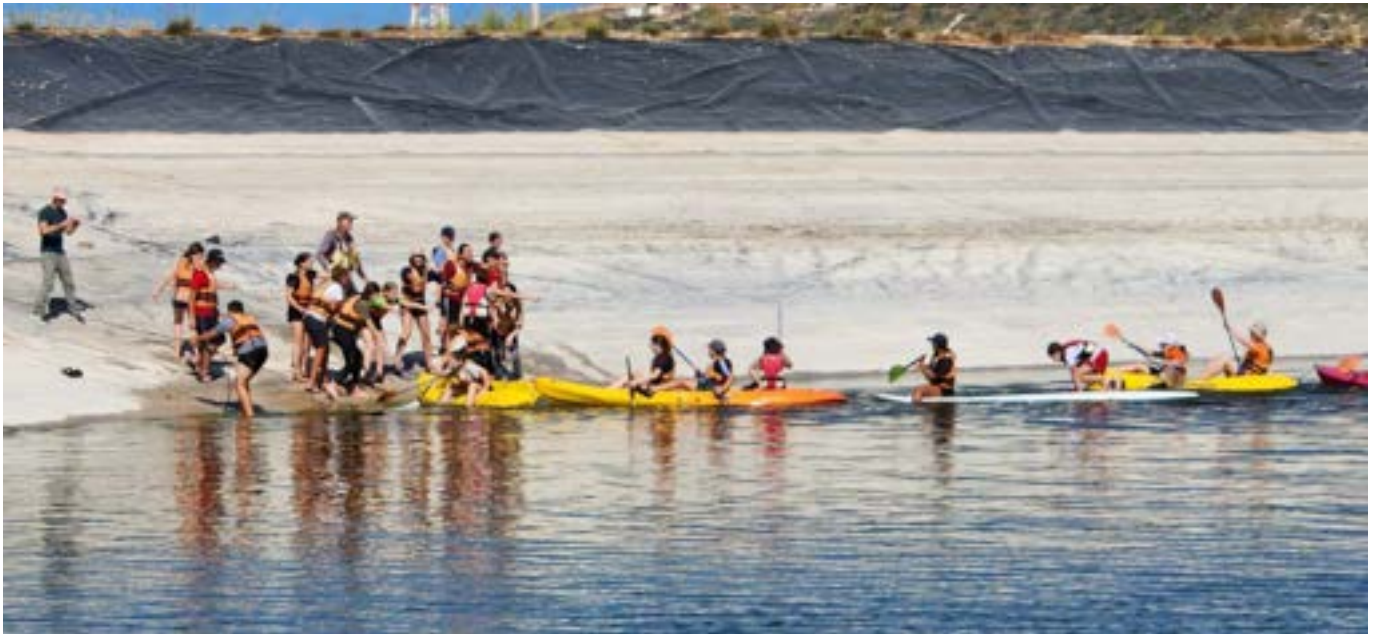
הנעורים יצאו בשישי בבוקר לפעילות במאגר של ראש הנקרה