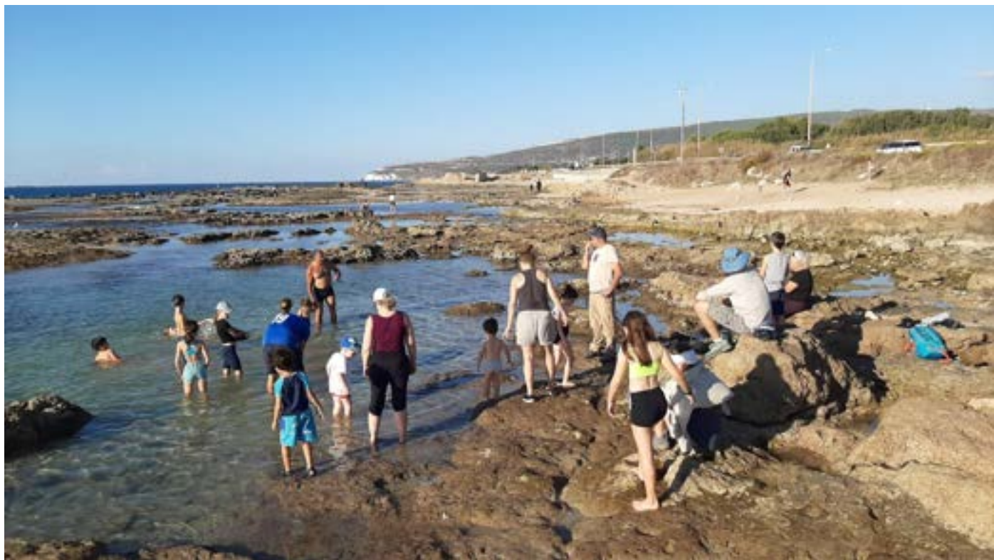
טיול ילדים - רחצה בחוף אכזיב דרומית לאנדרטה (שנמצאת בשיפוץ)