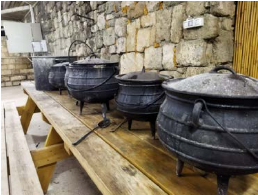
ארוחת ערב יום שישי - 5 סירי פויקה מפנקים מכל הסוגים