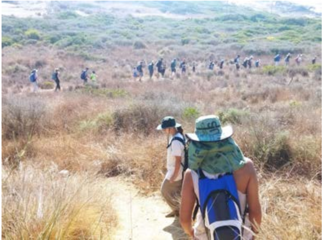
תחילת הטיול: ירידה ממצפה ראש הנקרה לחוף