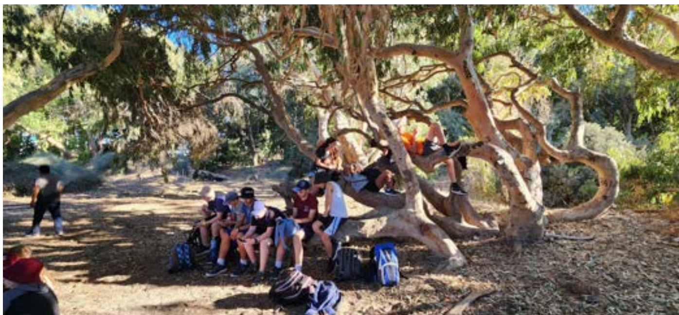
מנוחת נעורים בחניון חוף בצת